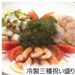
冷製三種祝い盛り