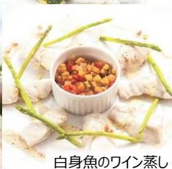
白身魚のワイン蒸し