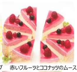
赤いフルーツとココナッツのムース