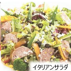
イタリアンサラダ