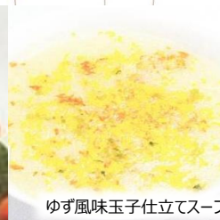
ゆず風味玉子仕立てスープ